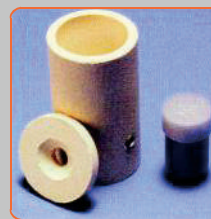
Cadweld One Shot 3415004

* Disponible para barra toma tierra 5/8 y cable de 35 mm