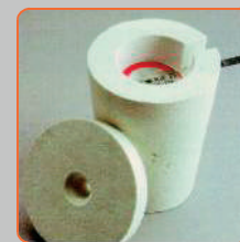
Cadweld Plus One Shot 3415001